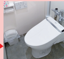
工事後(女性専用トイレ)

本事業に取り組んでいる中小企業は、東京都中小企業制度融資「女性活躍推進融資(TOKYOウイメン・ビズ・サポート)」の対象となり、信用保証料2/3補助や利率優遇を受けることができます。詳細は、下記URLにてご確認ください。