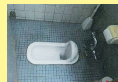
工事前 (元々は男性専用トイレ)

トイレのためにフロア移動することもなくなり、生産効率のアップにもつながっています!