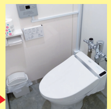
工事後 (女性専用トイレ)

本チラシ記載以外にも要件がございます。申請にあたっては当財団HP掲載の「募集要項」を必ずご確認ください。