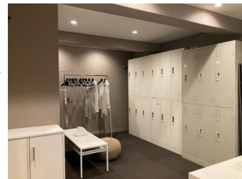
工事後(女性更衣室兼休憩室)